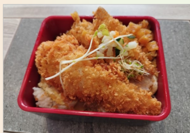
Fish fry Don