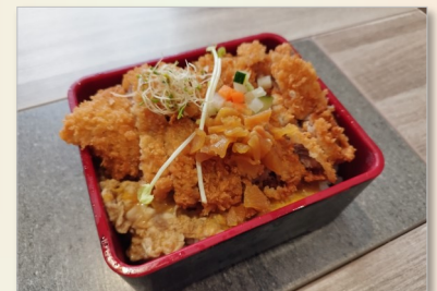
Porc Katsu Don