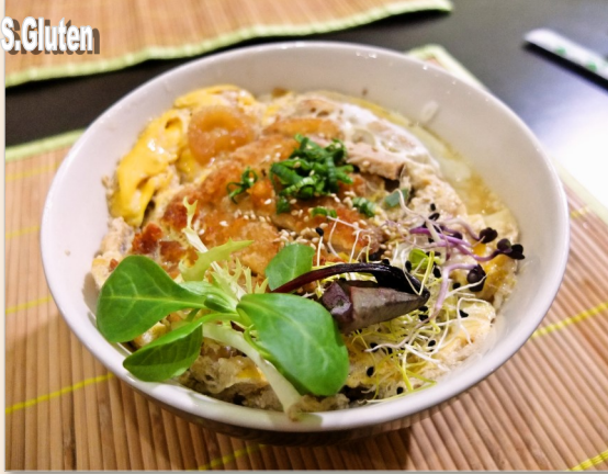
Chicken KatsuDon チキンかつ丼

Une grande faim ? Retrouvez tous les plats en version « Grand » pour 3€ de plus !