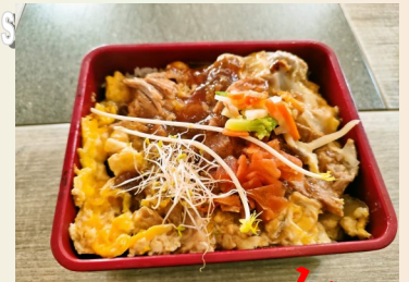
Amakara buta Don